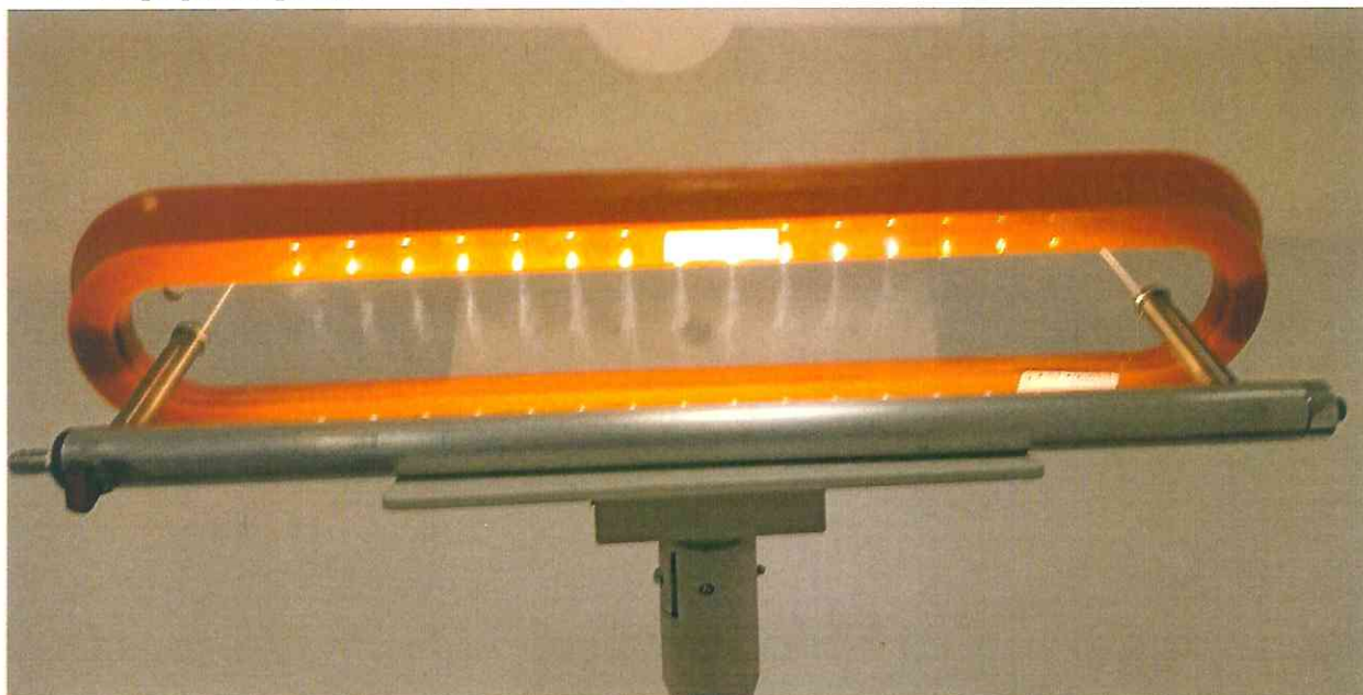
Рис.1. Фотография внешнего вида образца