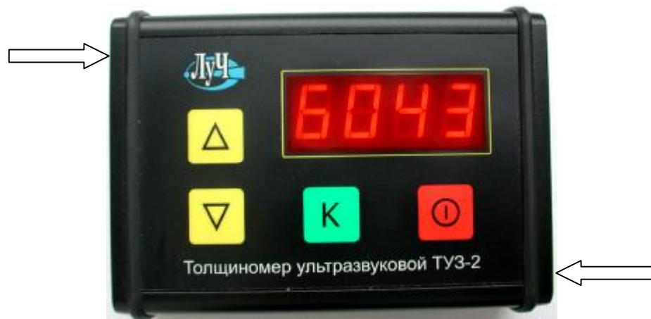
Рисунок 1 - Общий вид толщиномеров ТУЗ-2 и места нанесения пломбировки.

Фотография толщиномера представлена на рисунке 1.