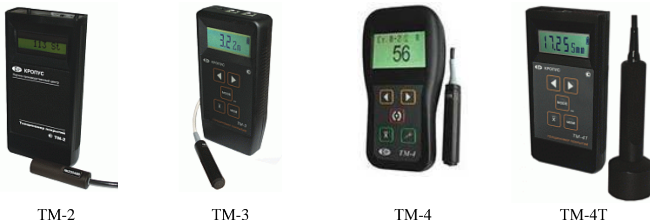
Рисунок 1 – Общий вид толщиномеров покрытий

Фотографии общего вида толщиномеров покрытий представлены на рисунке 1.