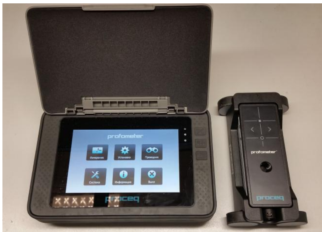
Рисунок 2 - Внешний вид прибора для измерения толщины защитного слоя бетона Profometer PM-6