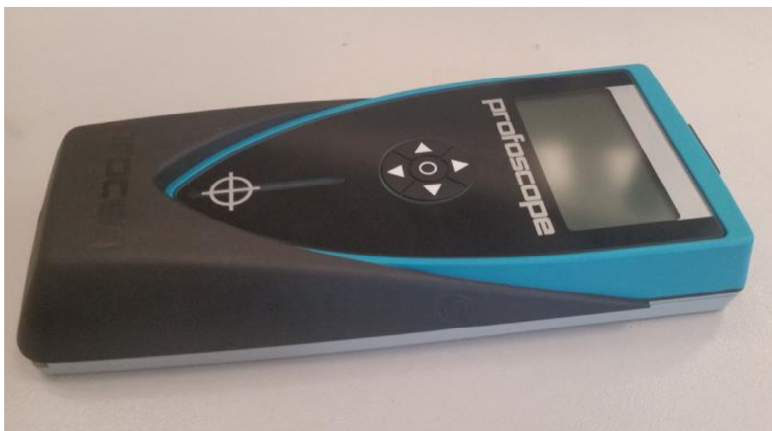
Рисунок 1 - Внешний вид прибора для измерения толщины защитного слоя бетона Profoscope