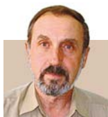
Гершкович Григорий Борисович