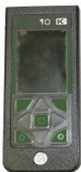
в) УДТ-10 (UDT-10)