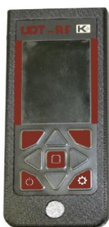
а) УДТ-RF (UDT-RF)