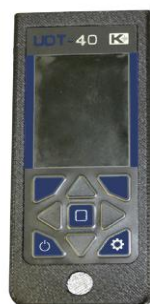
д) УДТ-40 (UDT-40)