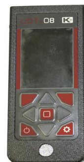
б) УДТ-08 (UDT-08)