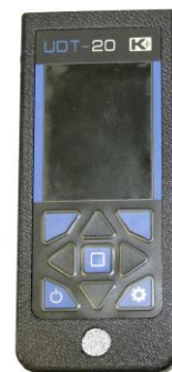
г) УДТ-20 (UDT-20)