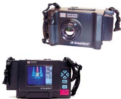
Термоэлектрический тепловизор-регистратор IR SnapShot

Измерение распределения температур (температурных полей) возможно как контактными, так и неконтактными методами [2]. Установка контактных температурных датчиков требовала в упомянутом случае значительных затрат на создание и поддержание работоспособности системы мониторинга температур в тоннеле. Но, если бы у строителей был тепловизор или хотя бы простейший пирометр, пригодный для измерения температур в пределах от -18^{\circ}\text{C} до 100^{\circ}\text{C} , а в регламент работ был бы вписан пункт об обязательном периодическом контроле температур по всему периметру тоннеля, включая свод, то катастрофы, возможно, удалось бы избежать.