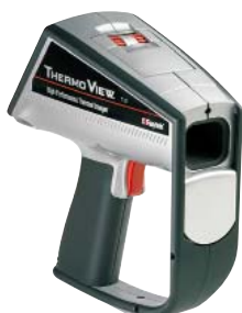
Тепловизор с функцией измерения температуры ThermoView