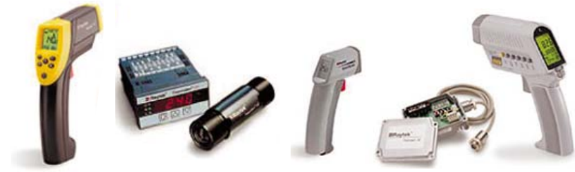
Портативные и стационарные пирометры для различных приложений

Одноэлементный приемник или один из приемников матрицы вместе с оптической системой в каждый момент времени можно рассматривать как отдельный пирометр. Линейное разрешение для тепловизора определяется через мгновенное поле зрения отдельного приемника. Для точного измерения температуры объекта с помощью тепловизора необходимо обеспечить следующее условие: размер измеряемой зоны объекта измерения должен быть больше мгновенного угла зрения одного приемника, но может быть меньше утроенного мгновенного поля зрения одного приемника в каждом из двух взаимно-перпендикулярных направлений, т. е. должен попадать в зону, охватываемую мгновенным углом зрения площадки из 3 \times 3 элементарных приемников. Данное требование должно соблюдаться при работе с любым объективом тепловизора, независимо от его фокусного расстояния. Быстродействие приемников определяет скорость получения термограммы и возможность регистрации быстропротекающих процессов.