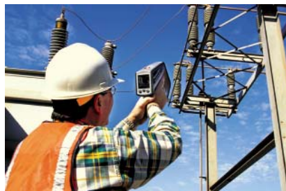
Измерения температуры новым тепловизором ThermoView Ti30 фирмы Raytek

направлением, с которого наблюдается контролируемый участок. Среда между объектом и прибором может поглощать излучение в диапазоне спектральной чувствительности измерительного прибора. Кроме поглощения на измерение температуры может оказывать влияние наличие рассеянного или отраженного от объекта излучения. Влияние поглощения излучения средой, рассеяние и отражение излучения должны учитываться при проведении измерений с помощью бесконтактного средства измерения температуры.