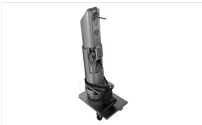
Рис. 3 – Система фокусировки лазера с ирисовой диафрагмой