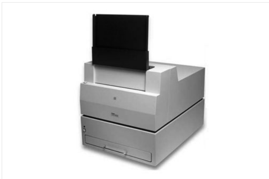
Рис. 1 — Сканер Kodak ACR2000i

К сканерам, считывающим только ЗП относятся все Фосфоматики выполненные на базе сканера ACR2000, сканер GE CR50P, GE CRx25P, Duerr HD-CR 35 NDT, CR 35 NDT, Скринтест