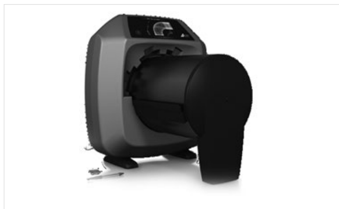
Рис. 4 – Новый сканер Duerg HD-CR 35 NDT