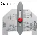
AWS Weld Gauge