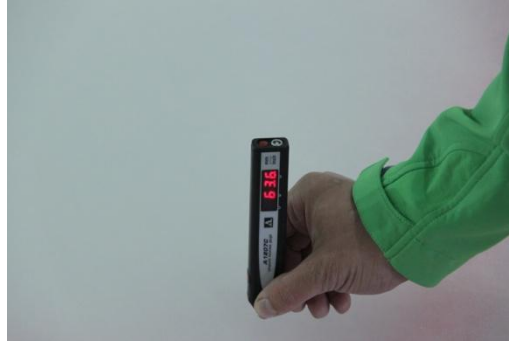
Рисунок 12 Показания прибора – 63.6 мм (Реальное значение – 63.7 мм)

По окончании измерений, полученные результаты были сопоставлены с реальными значениями, измеренными при помощи штангенциркуля. Сравнение показало схожесть, стабильность и точность полученных значений. Для дополнительного контроля полученных результатов было проведено повторное сверление на исследуемых участках. Погрешность измерений не превысила 0.5 мм, что обусловлено неоднородностью структуры льда.