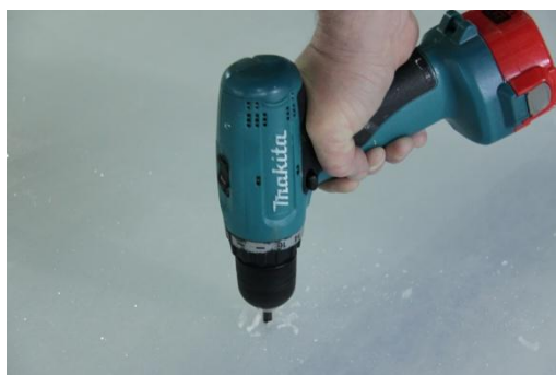
Рисунок 2 – Сверление льда для настройки и проверки толщиномера

Для определения скорости распространения ультразвука на конкретном участке льда необходимо знать его реальную толщину. Для этого сотрудники спорткомплекса выполнили ряд сверлений в ледовом покрытии (рисунок 2). Глубина каждого сверления была измерена с помощью электронного штангенциркуля (рисунок 3).