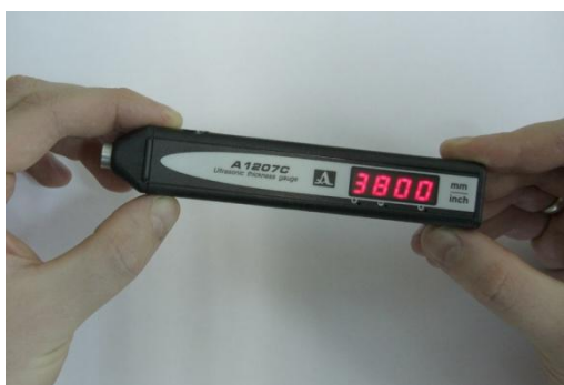
Рисунок 4 – Найденное значение скорости распространения ультразвука

На основании показаний штангенциркуля была проведена настройка толщиномера А1207С с целью определения скорости распространения ультразвука в ледовом покрытии. Результат составил V_{л}=3800 м/с. Данное значение было сохранено в память прибора и выбрано в качестве текущего для последующих измерений (рисунок 4). Для проверки точности получаемых результатов и корректировки полученной скорости были сделаны еще несколько сверлений на других участках ледового покрытия.