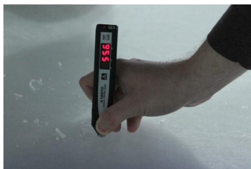
Рисунок 7 Показания прибора – 55.6 мм (Реальное значение – 56.0 мм)