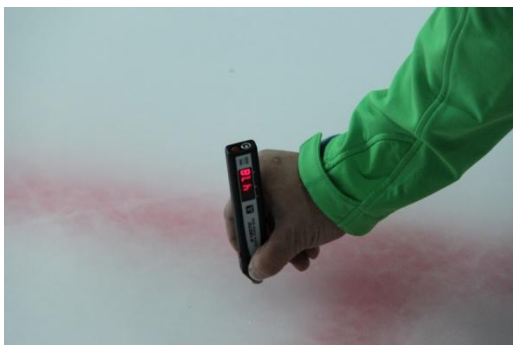
Рисунок 8 Показания прибора – 47.8 мм (Реальное значение – 47.9 мм)