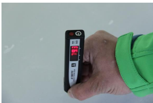
Рисунок 10 Показания прибора – 79.3 мм (Реальное значение – 79.32)