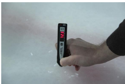
Рисунок 6 Показания прибора – 72.3 мм (Реальное значение – 72.6 мм)