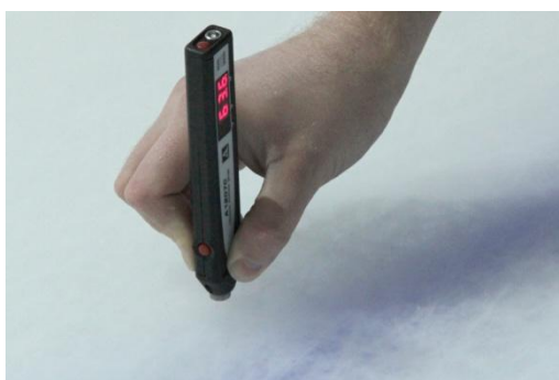
Рисунок 5 – Процесс измерения толщины льда

3. Перед началом измерений специалист компании ООО «Акустические Контрольные Системы» выбрал из памяти прибора полученное значение скорости ультразвука, а затем провел ряд замеров на нескольких участках ледяного покрытия. Разовый измерительный процесс занял всего несколько секунд. Достаточно было вертикально установить толщиномер А1207С на поверхность льда, удерживая прибор одной рукой за уступы расположенные в нижней части электронного блока (рисунок 5). Данный вариант экспресс-контроля осуществлялся оперативно и эффективно - прибор перемещался с одного участка льда на другой с фиксацией результата измерений на каждом участке.