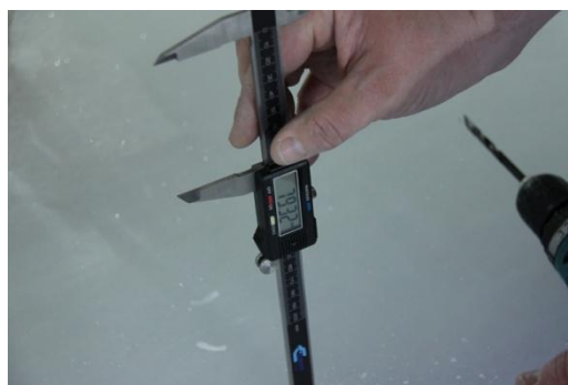
Рисунок 11 Реальное значение – 79.32 мм (Показания прибора – 79.3 мм)