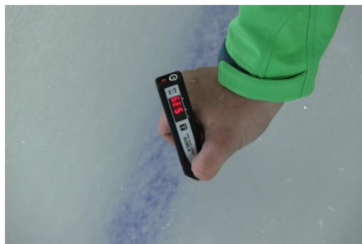
Рисунок 9 Показания прибора – 53.9 мм (Реальное значение – 54.4 мм)