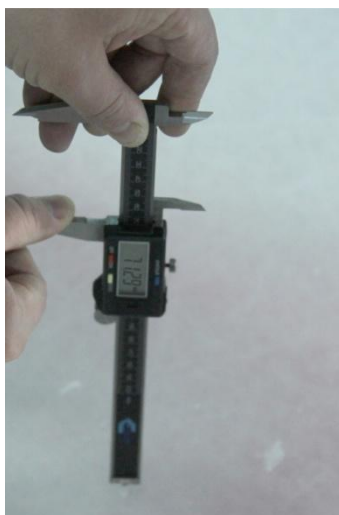
Рисунок 3 – Измерение толщины льда с помощью электронного штангенциркуля

На основании показаний штангенциркуля была проведена настройка толщиномера А1207С с целью определения скорости распространения ультразвука в ледовом покрытии. Результат составил V_{л}=3800 м/с. Данное значение было сохранено в память прибора и выбрано в качестве текущего для последующих измерений (рисунок 4). Для проверки точности получаемых результатов и корректировки полученной скорости были сделаны еще несколько сверлений на других участках ледового покрытия.