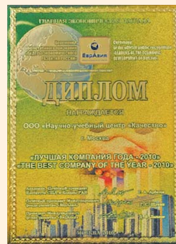
Рис. 2. Награды НУЦ «Качество»